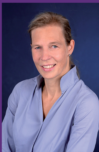
INGRID KLEIN © Ev. Kitaverband Mitte-West

Wir fordern, dass das Versprechen, jedem Kind einen rechtssicheren Anspruch auf einen Kitaplatz zu gewährleisten, durch den zukünftigen Berliner Senat durch Unterstützung der Träger kurzfristig realisiert wird.