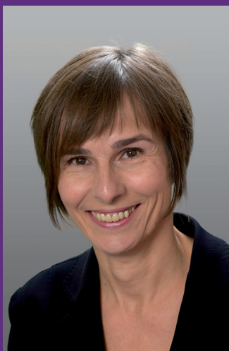
SIEGLINDE HENRICHS

Sieglinde Henrichs, Fachberaterin für Kitas im Verband Evangelischer Kindertageseinrichtungen Süd